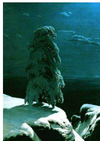
Иван Шишкин. На Севере диком..., 1891.

Творческая составляющая задания может быть усложнена предложением составить словесное описание замысла пейзажа – как заказа художнику, указав желаемую композицию, ракурс, характерные черты изображаемого и способы их достижения.