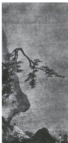
Ма Юань. Лунный свет. Живопись тушью на шелке. XII-XIII вв.

2. Какие эмоциональные доминанты, по Вашему мнению, существуют в каждом произведении?