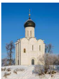
2. Храм Покрова Пресвятой Богородицы на Нерли