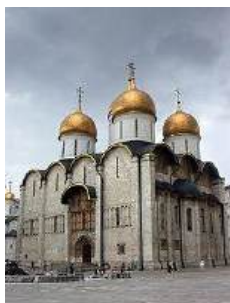
1. Успенский собор в Московском Кремле