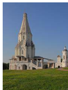
3. Церковь Вознесения Господня в Коломенском (Москва)